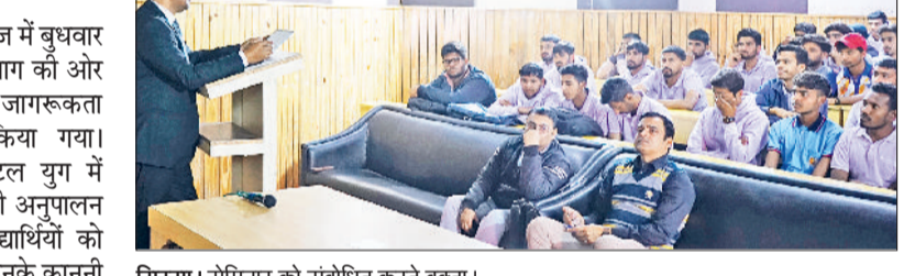
सिरसा। सेमिनार को संबोधित करते वक्ता।

कहा कि आज का समय पूरी तरह डिजिटल प्लेटफॉर्म पर आधारित है। सोशल मीडिया, ऑनलाइन ट्रांजेक्शन, ई-लर्निंग और डेटा शेयरिंग जैसी गतिविधियों में जरा-सी लापरवाही भी कानूनी परेशानी का कारण बन सकती है। उन्होंने बताया कि टॉट कानून व्यक्ति के अधिकारों की रक्षा करता है और किसी के द्वारा की गई लापरवाही या गलत कार्य के लिए जिम्मेदारी तय करता है। उन्होंने विद्यार्थियों को साइबर क्राइम, फेक प्रोफाइल, डेटा चोरी, ऑनलाइन फ्राड शेयरिंग जैसी गतिविधियों में जरा-सी लापरवाही भी कानूनी परेशानी का कारण बन सकती है। उन्होंने बताया कि टॉट कानून व्यक्ति के अधिकारों की रक्षा करता है और किसी के द्वारा की गई लापरवाही या