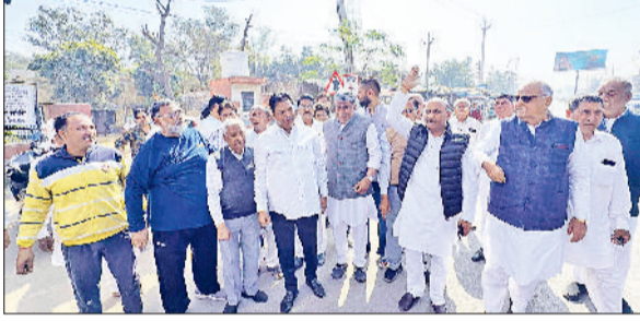
सिरसा। पुलिस चौकी के बाहर रोष जताते कांग्रेस कार्यकर्ता।