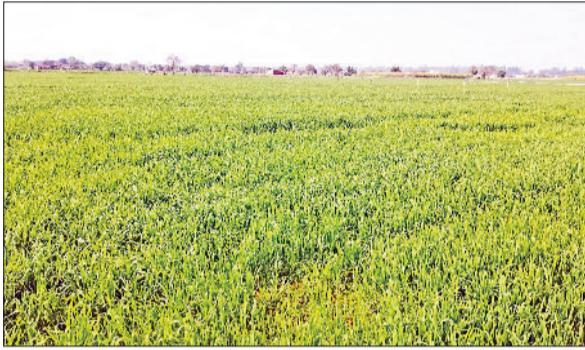
फतेहाबाद। खेतों में खड़ी गेहूं की फसल।

जिले में फरवरी के अंतिम सप्ताह में मौसम का मिजाज बदलने लगा है। बुधवार को दिन में तेज धूप के कारण तापमान में बढ़ोतरी दर्ज की गई। मौसम विभाग के अनुसार बुधवार को अधिकतम तापमान करीब 29 से 30 डिग्री सेल्सियस के बीच रहा, जबकि न्यूनतम तापमान 13 से 14 डिग्री सेल्सियस के आसपास दर्ज किया गया। सुबह और शाम के समय हल्की ठंडक महसूस हुई, लेकिन दोपहर में गर्मी का असर बढ़ गया। रात और दिन दोनों समय पारा डबल डिजिट में पहुंच रहा है, जबकि आम तौर पर यहां मार्च की शुरुआत तक हल्की ठंड बनी रहती है। मौसम विशेषज्ञों का कहना है कि आने वाले दिनों में तापमान में धीरे-धीरे और बढ़ोतरी होने की संभावना है। 28 फरवरी के बाद और मार्च की शुरुआत में दिन का तापमान और अधिक बढ़ सकता है। इसके चलते दिन में गर्मी बढ़ेगी, जबकि सुबह-शाम हल्की ठंड बनी रह सकती है। बदलते मौसम को देखते हुए स्वास्थ्य