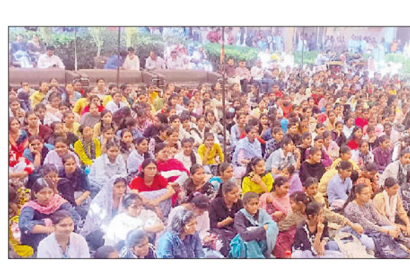
सिरसा। महिला कॉलेज में आयोजित सांस्कृतिक कार्यक्रम का आनंद लेती छात्राएं।

राजकीय महिला महाविद्यालय सिरसा में आयोजित दो दिवसीय वार्षिक सांस्कृतिक कार्यक्रम आगाज के अंतिम दिन सांस्कृतिक कार्यक्रम की धूम छाई रही। महाविद्यालय परिसर उत्साह, ऊर्जा और सांस्कृतिक रंगों से सराबोर रहा। कार्यक्रम की शुरुआत भजन एवं शब्द की मनमोहक प्रस्तुतियों से हुई, जिनमें आध्यात्मिकता और