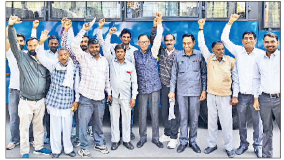
सिरसा। मांगों को लेकर रोष जाहिर करते कर्मचारी।