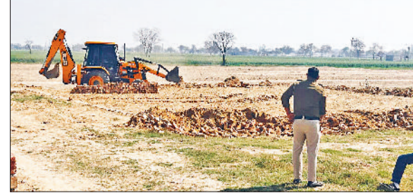
भूना। टोहाना रोड पर बुधवार को जिला नगर योजनाकार विभाग द्वारा अनधिकृत कॉलोनियों में तोड़-फोड़ करती जैसी भी मशीन।