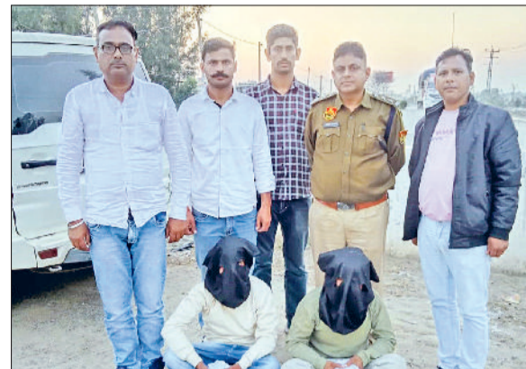
फतेहाबाद। अफीम सहित पकड़े गए झारखंड के दोनों युवक।