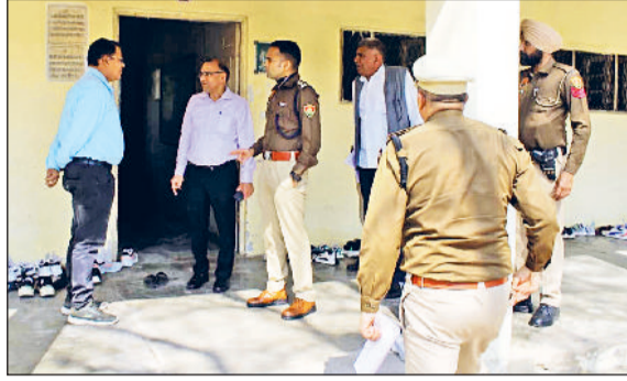
फतेहाबाद। परीक्षा केंद्रों का निरीक्षण करते डीसी-एसपी।