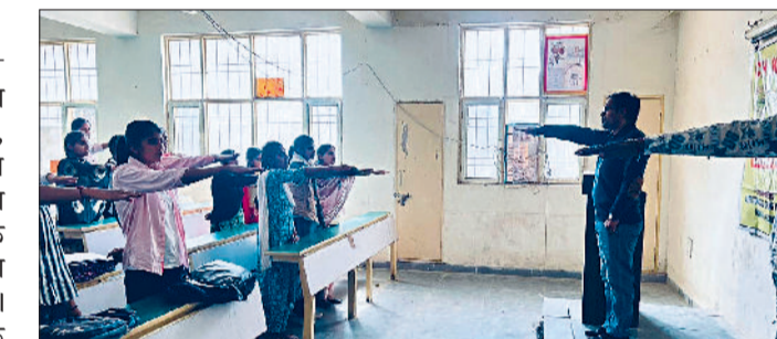
विस्तार से चर्चा करते हुए बताया कि नशा मुक्ति अभियान का उद्देश्य नशे से दूर रहना है। नशा मुक्ति अभियान का उद्देश्य नशे से दूर रहना है। नशा मुक्ति अभियान का उद्देश्य नशे से दूर रहना है।